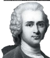
François Marie Arouet (Voltaire), René Descartes e Jean-Jaques Rousseau, os três principais filósofos racionalistas.

Mas o racionalismo tem sua causa num erro ainda mais baixo, o naturalismo, que afirma a existência apenas da realidade natural, que podemos ver e a nossa ciência pode atestar; Deus, o pecado original, a graça, o juízo, o paraíso e o inferno – a realidade sobrenatural – são apenas elementos de uma mitologia que cabe a cada um escolher entre acreditar ou não. Se Deus não existe, não criou o universo e nem tampouco governa todas as coisas; suas leis não podem, então, ser impostas nem aos homens e nem à sociedade. A consequência é que se nega a lei natural, que é “a lei eterna gravada nos seres dotados de razão inclinando-os para o ato e o fim que lhes convenha; e este não é senão a razão eterna de Deus, Criador e Governador do mundo” 13 .