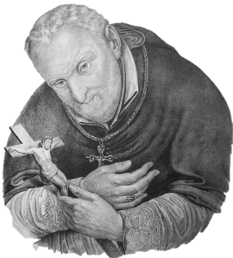
Santo Afonso Maria de Ligório.

“Um sem número de cristãos se perde por não querer evitar as ocasiões de pecado. Quantas almas lá no inferno não se lastimam e queixam: Infeliz de mim! Se tivesse evitado aquela ocasião, não estaria agora condenado por toda a eternidade!”