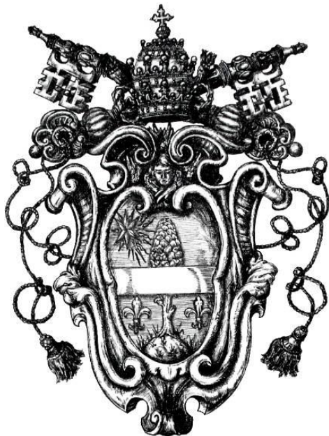
Brasão pontifício de S. S. Papa Leão XIII

Estamos atualmente na era das opiniões. Todo mundo tem uma opinião formada – subjetivamente é claro – sobre tudo: os programas de televisão e os canais de Youtube , por exemplo, sobrevivem disto. Esse pensamento penetrou até mesmo na Igreja: nenhum católico que se preze põia o aborto, mas com relação a outras questões, como o divórcio e a relação entre Igreja e Estado, “o honesto e o desonesto já não diferem na realidade, mas somente na opinião e no juízo de cada um: o que agrada será permitido” 10 . É o erro do subjetivismo, consequência do liberalismo, que está profundamente arraigado nas nossas sociedades, nascidas da Revolução Francesa.