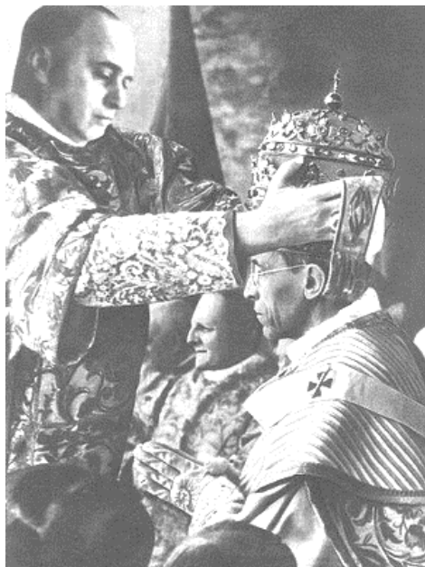
Cerimônia de Coroação do Papa Pio XII

paulatinamente pelo racionalismo, o naturalismo, o evolucionismo, o existencialismo, o falso historicismo, enfim, teorias e doutrinas que rebaixam o homem à uma "racionalidade" sem Deus, que poderia sem prejuízo à verdade ser chamada de "irracionalidade panteísta", pois faz, no fim, o homem crer ser a própria divindade.