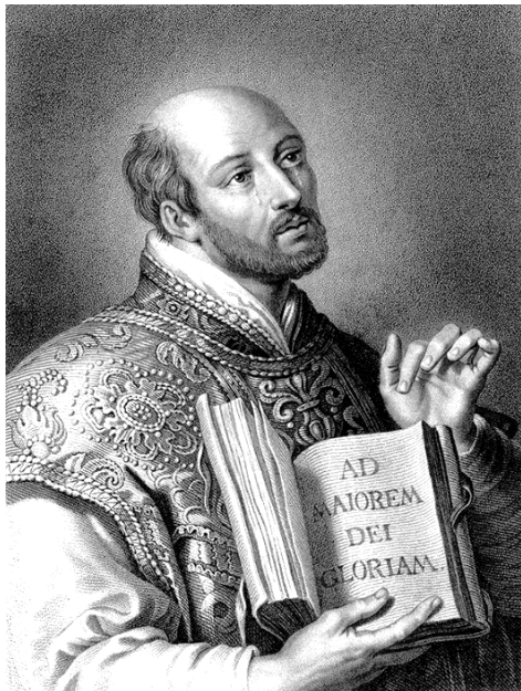
Lema de Santo Inácio: "Para a maior glória de Deus"

No dia 31 de Julho a Igreja celebra o dia de Santo Inácio de Loyola, cheio de zelo pela Santa Igreja e fundador da Ordem dos Jesuítas. Para a Congregação Mariana é um santo de grande importância, mesmo não tendo sido ele mesmo um congregado mariano, foi a partir de seu apostolado que Deus Nosso Senhor fez surgir esta congregação de Nossa Senhora.