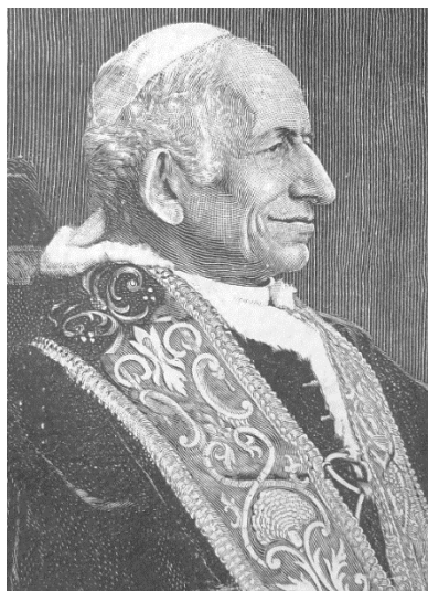
Segundo este grande Pontífice, as Congregações Marianas são “excelentes escolas de piedade cristã e baluartes segurísimos de inocência juvenil” .