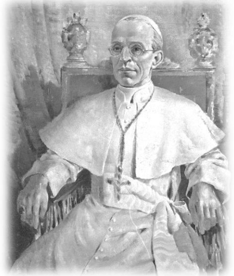
Pintura a óleo de Pio XII

A prova disso é que cada vez mais dificilmente se encontram católicos dispostos a defender os dogmas, e ainda mais dificilmente, aqueles que defendem a verdade da Infalibilidade Papal.