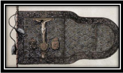
Estandarte da Santa Liga

muçulmano e para impedir que o flagelo maometano se alastrasse pela Europa. O ponto de encontro foi na Sicília e de lá partiram para o local de batalha, que era próximo a Lepanto, na costa da Grécia. Imediatamente após o fim das tratativas, São Pio V conclamou toda a Cristandade a rezar e fazer penitência para que Deus ouvisse seus clamores e desse a vitória aos cristãos. Em uma verdadeira Cruzada, os fiéis faziam procissões e rezavam especialmente o Santo Rosário, para que Nossa Senhora, medianeira de todas as graças, lhes fosse particularmente favorável.