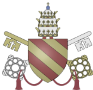
Brasão do Papa São Pio V

Dado em Roma, junto de São Pedro, sob o Anel do Pescador, aos 17 de setembro de 1569, quarto de nosso Pontificado. ”