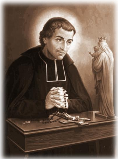
São Luís Maria G. de Montfort

Ressaltamos ainda quão proveitoso é rezar o Santo Rosário por este método diante do Santíssimo Sacramento, sendo assim possível obter indulgência plenária 1 nas condições usuais, ou seja, havendo confissão e comunhão.