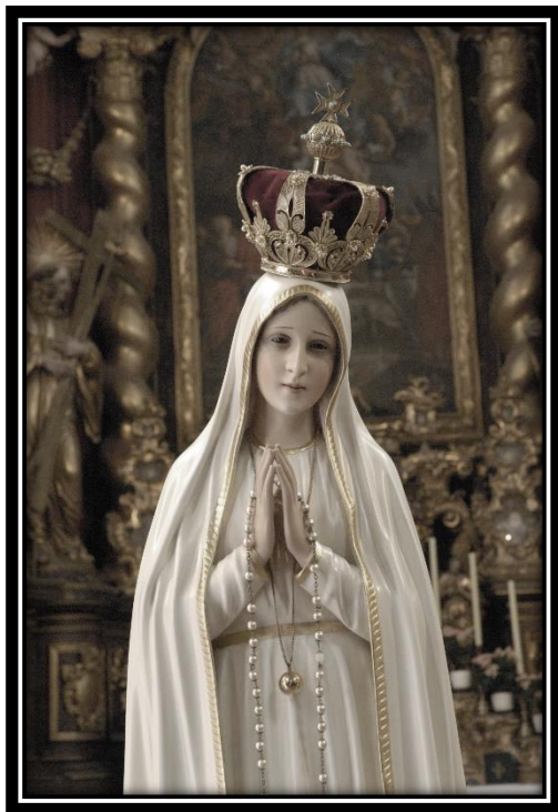
Nossa Senhora de Fátima, rogai por nós

As aparições de Nossa Senhora do Rosário em Fátima, em conjunto com as aparições em La Salette e em Lourdes falam diretamente de uma grande investida contra a Igreja, que sofre sua Paixão como Nosso Senhor. Que Nossa Senhora nos conceda a graça da perseverança final nestes tempos de confusão e dificuldades.