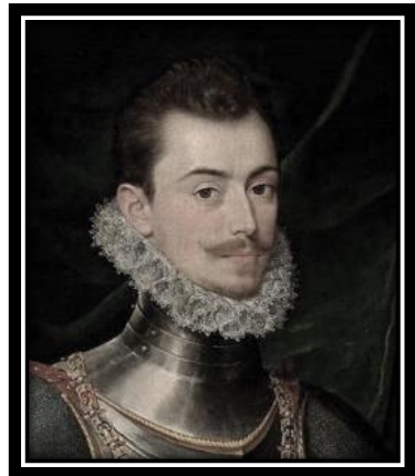
Dom João D'Áustria

Após duro embate, finalmente a Santa Liga se saiu vitoriosa, tendo como grande auxílio o Santo Rosário que era rezado em toda a Europa. Com a conquista de tão importante vitória e o livramento da Europa das garras maometanas, São Pio V seguiu a entoar o Te Deum, instituiu a festa do Santo Rosário e adicionou o título de Auxílio dos Cristãos à Ladainha de Nossa Senhora.