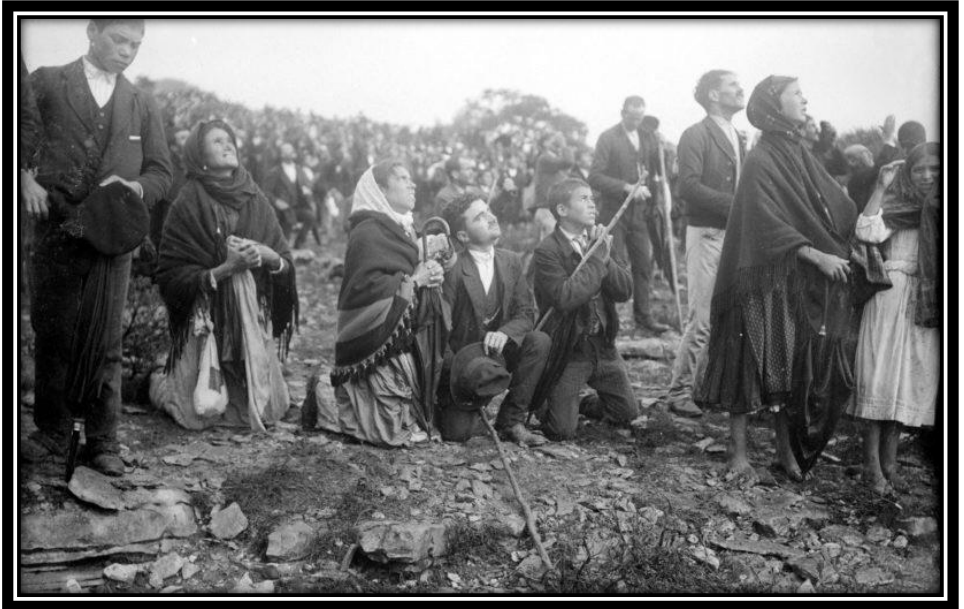
Cerca de 70 mil pessoas presenciaram o milagre do sol

“No momento em que Ela se elevava da azinheira e rumava para o